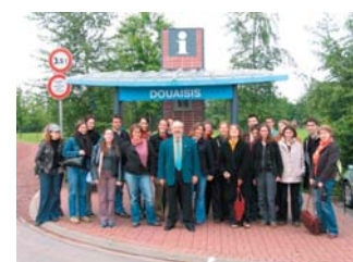
L'équipe des stagiaires accompagné du Secrétaire Général de l'association.