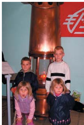
Photo des enfants.

- Grâce au travail d'Inouït, prestataire en charge du site Internet www.bmu2005.com , l'association s'est vu décerner le 1 er prix du concours Nordnet le 3 juillet dernier au titre de plus beau site régional professionnel.