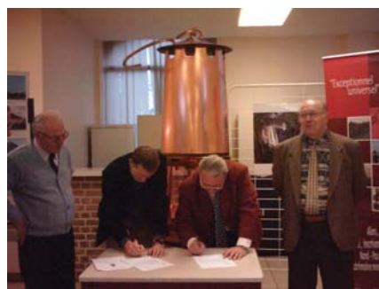
Signature de la charte de création du club le 12 novembre 2004.