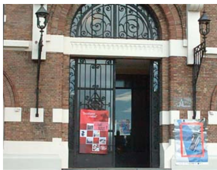
Faculté Jean Perrin à Lens lors des Journées du Patrimoine 2004

Merci à tous les clubs, partenaires et bénévoles pour leur inépuisable bonne volonté.