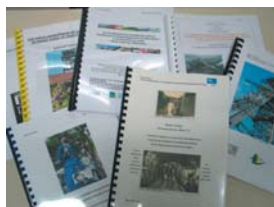
Les rapports des stagiaires