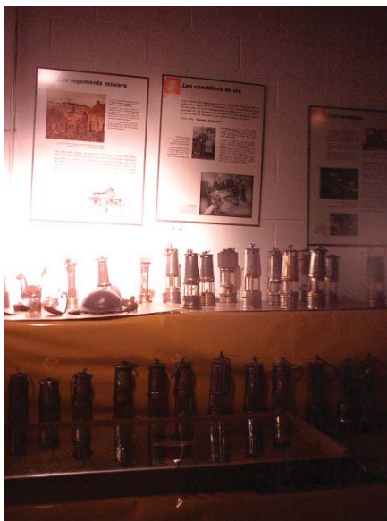
Lampes de mineur lors de la semaine de la mine Cora Courrières

Tandis qu'au même instant une dame se reconnaissait sur une photo, alors qu'elle travaillait comme trieuse !