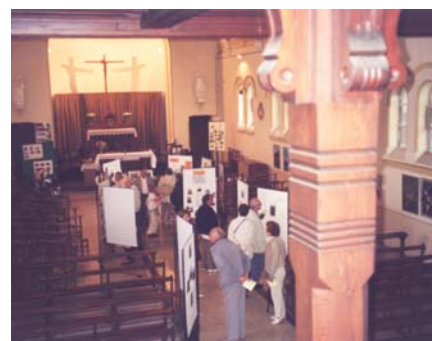
Eglise Saint Théodore à Lens lors des Journées du Patrimoine 2004